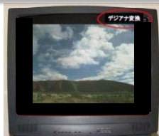
画面の上下左右が黒帯の例

機器の仕様により動作が異なる場合がありますので、ご注意ください。 詳しくはお使いの機器の取扱説明書などでご確認ください。