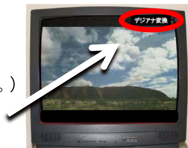
デジアナ変換視聴中の画面(例)

ご覧の放送がデジアナ変換されたものかどうかは、画面右上の表示「デジアナ変換」でわかります。