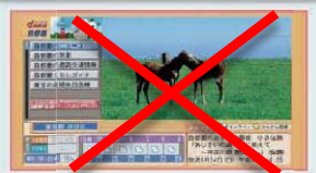
データ放送の画面例