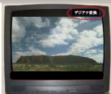
画面の上下が黒帯の例