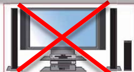
5.1サラウンド機器を使っても サラウンドでは聴けません